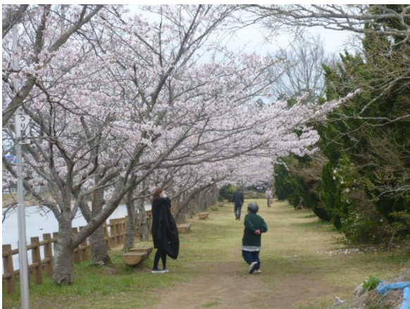
—サクラが満開の尼ヶ台公園—

厳しい寒さも終わり農家の皆さんは田植えの準備に入りました。サクラの花は満開となり、カエルの鳴き声も聞こえる村は人の心をホッとさせます。3.11 東日本大震災から4年が過ぎ、いまだ22万人が住居を奪われて生活しています。一日も早い復興を願っています。子ども達は入学、卒業の時期を迎え、それぞれ希望に胸をふくらませて小・中学校に通いはじめています。