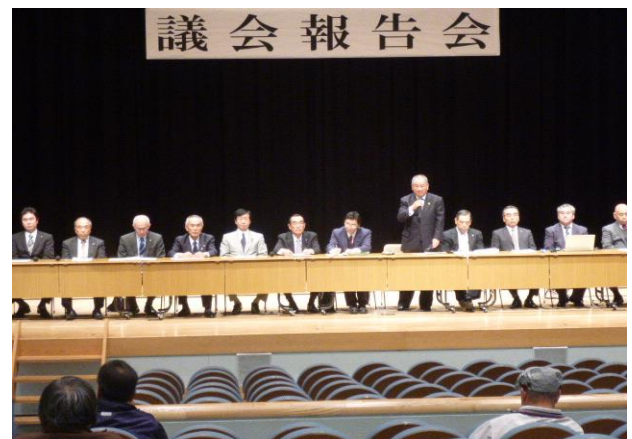
—3月28日・長生村文化会館—

「幸福の科学・私塾の開学」に大挙して塾生が入村し、地域住民の不安を解消する村の対応策についての質疑は的を射ていたと思えます。また、子育て支援の充実として児童館の設置は子育て中のお母さんの切実な質問でした。