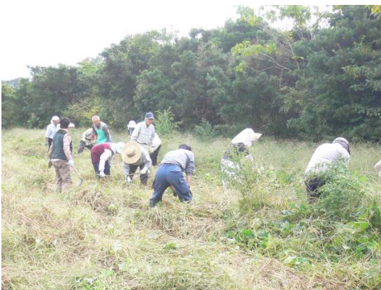
ながいき村・芋焼酎づくり

高岡町長より「この町も平成の合併騒動があった。島北部の旧村は合併で寂れ小学校の廃校を検討しています。役場は残すことが大事。合併すれば交付税の削減で予算規模が小さくなるので合併推進とはならなかった。徳之島は長寿の島であり、健康のまち宣言をしている。人口 13000 人で、100 歳以上の方が 30 人いる」…。とのこと。※長生村は 100 歳以上のお年寄り は 3 人 であり ます。