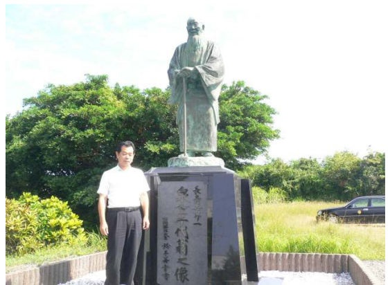
—徳之島・泉重千代さんの銅像—